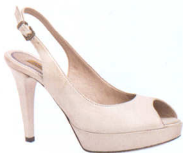
Scarpa in pelle bianca con tacco. www.janetandjanet.com