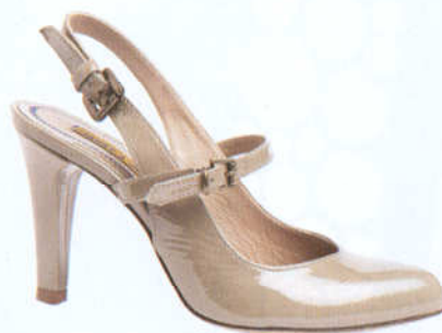
Scarpa in vernice tortora con tacco. www.janetandjanet.com