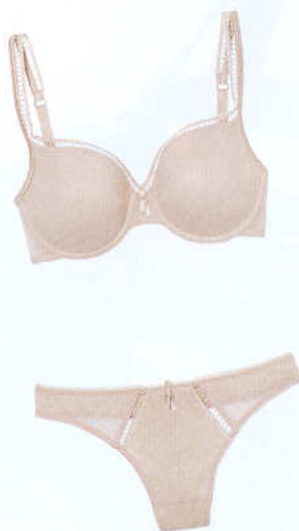
Completo intimo della serie C Chic di Chantelle, realizzato in maglia jacquard e lycra, proposto nella variante Perfect Nude. www.chantelle.com