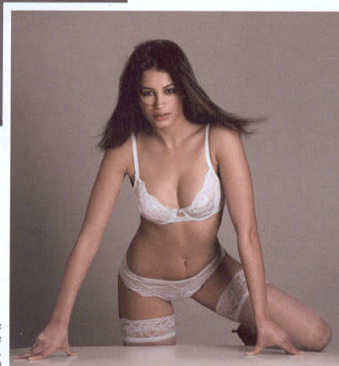
Completo bianco della serie Fabulous, dedicata alle forme generose (dalla 34C in su). www.lovable.com