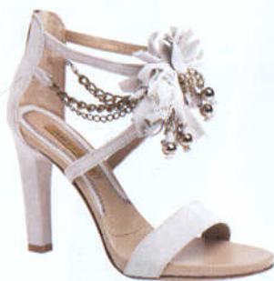
Sandalo in pelle bianco con catenine e fiocco. www.janetandjanet.com