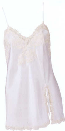
Sottoveste La Perla Maison in seta bianca con spacco laterale profilata in pizzo avorio. www.laperla.com