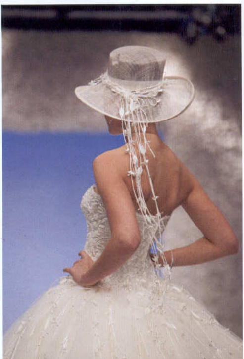
Abito con corpetto in pizzo francese impreziosito da cristalli swarovski e cappello. www.ameliasablanca.com