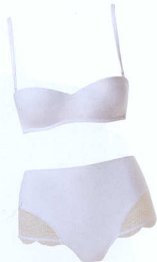
Completo con panty alto in lycra stretch e inserti di pizzo chantilly di La Perla Bridal. www.laperla.com